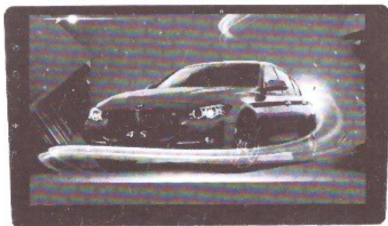
Car Audio And Video System